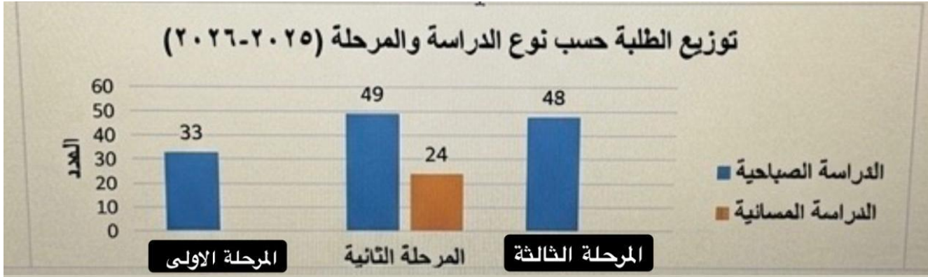
الشكل (3) اعداد الطلبة للعام 2026-2025 موزعين بحسب المراحل الدراسية