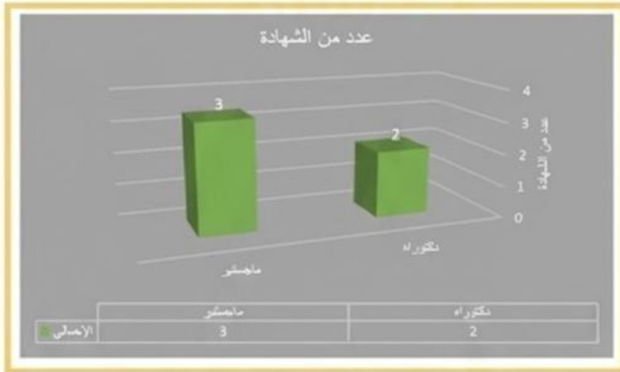
الشكل (2) توزيع الملاك التدريسي للقسم بحسب الشهادة