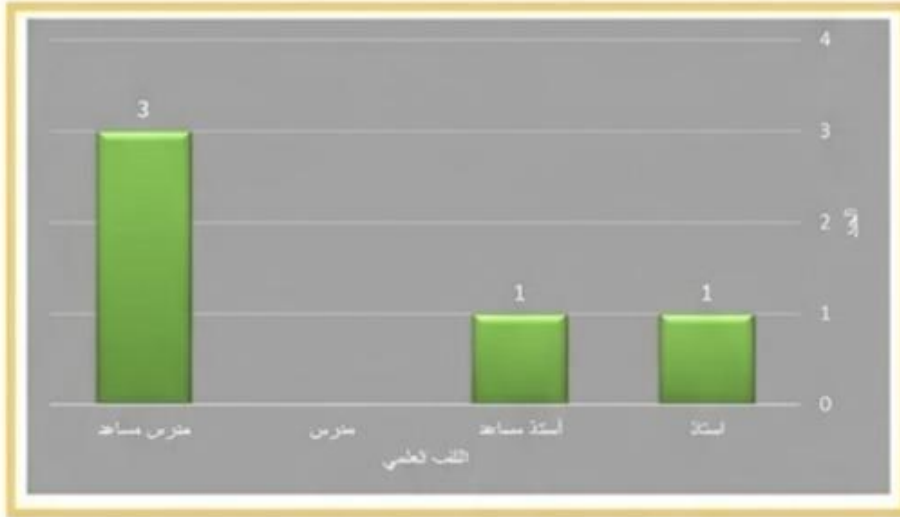
الشكل (1) توزيع الملاك التدريسي للقسم بحسب اللقب